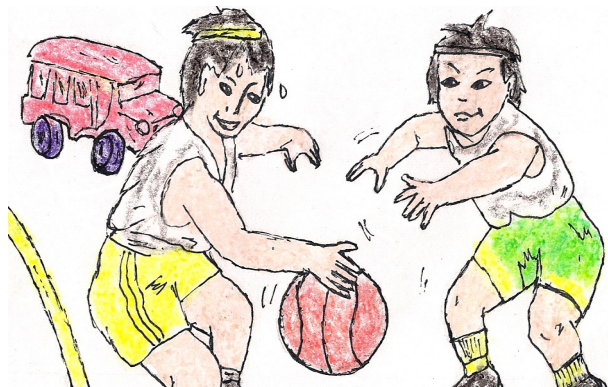
Ndi' meglemet dia titenga' bianan nu nga trak.