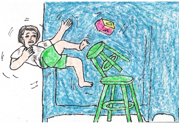
Ndi' mesu'at megindeg dia ditaas banku' bu' nu gininisan ndi' mpagen.