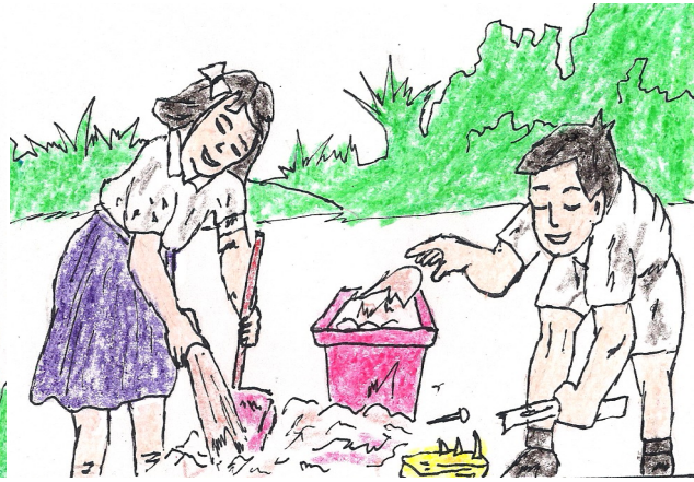
Ipesen sug dala metalem ma' nu ngag lansang bu' migbuung butilia dia peglemetan nu nga gembata'.