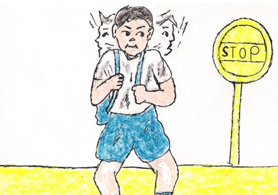
Kimanan deli' ig bianan sa' ndi' pa meglaad.