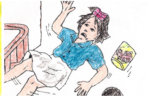
Ndi' pelebianaan pesinaway su saleg.