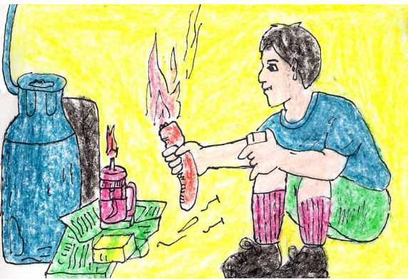
Peleyu'en su puspuru dig dalag gembeta'an.