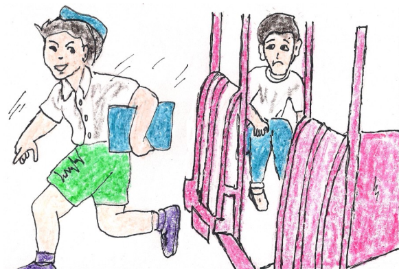
Ndi' menaug sa' migebek pai sekayen.